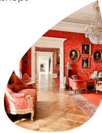
Museen Schloss Aschach

Das Graf-Luxburg-Museum ist das Herzstück der Museen Schloss Aschach. Spannend für jedes Alter auch das Volkskunde- und Schulmuseum 97708 Aschach www.museen-schloss-aschach.de