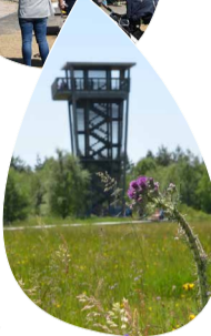
Aussichtsturm Schwarzes Moor

Naturlehrpfad Schwarzes Moor mit Aussichtsturm Rundwanderweg auf Bohlen ca. 2 km mit Schautafeln, seltenen Tier- und Pflanzenarten. Führungen möglich. 97650 Fladungen, Dreiländereck www.rhoen.de/urlaub-kultur-ferien-wellness/wandern-natur/lehrpfade