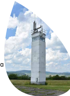
Wachturm Point Alpha

Spannende geologische Entdeckungsreise 97717 Euerdorf www.terra-triassica.de