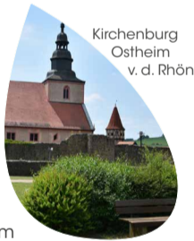
Kirchenburg Ostheim v. d. Rhön

Ostheim v. d. Rhön Besterhaltene Kirchenburg Deutschlands, Orgelbaumuseum, Lichtenburg, Wanderweg „Extratour Ostheimer“ 97645 Ostheim www.ostheimrhoen.de