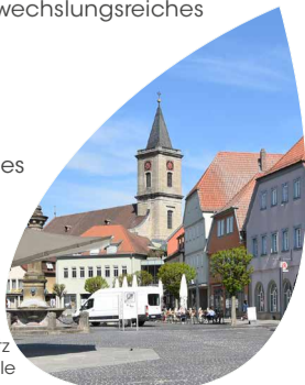
Marktplatz Bad Neustadt a. d. Saale

Fladungen Nördlichste Stadt Bayerns. Fränkisches Freilandmuseum, Rhönzüge etc. 97650 Fladungen www.fladungen-rhoen.de